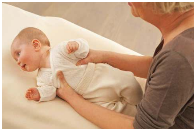
... Sie erklären ihm, was Sie mit ihm vorhaben, und drehen es dann auf die Seite, indem Sie Brust und Rücken mit beiden Händen stabilisieren.