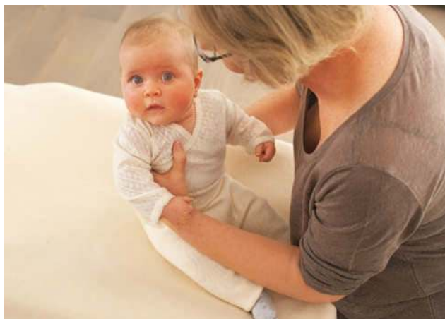
Lassen Sie Ihr Baby kurz zum unterstützten Sitzen kommen, bevor Sie es endgültig hochheben.