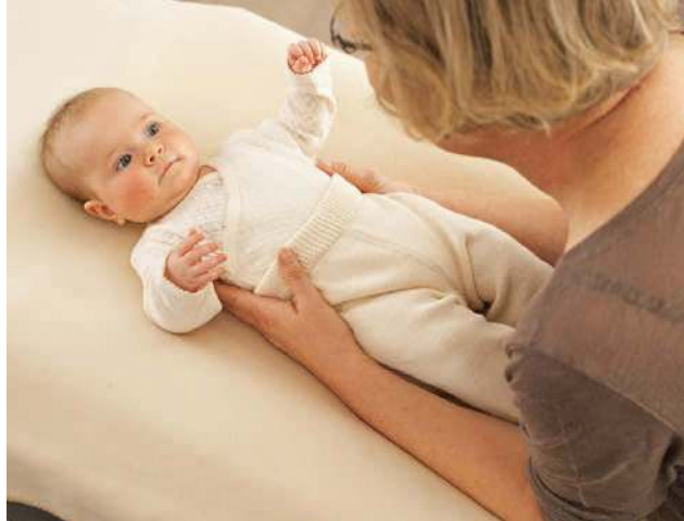
Zum Hochnehmen aus der Rückenlage nehmen Sie Ihr Baby zunächst im Schalenriff ...

Wenn Sie Ihr Baby aus der Bauchlage (in der Ihr Baby aber nicht schlafen sollte!) hochnehmen möchten, drehen Sie es zunächst zur Seite. Dazu stabilisieren Sie mit einer Hand Schulter und Rücken Ihres Babys und mit der anderen den Brustkorb. Sagen Sie ihm, was Sie vorhaben. Wenn es sich auf seinem unteren Arm etwas abstützen kann, ist es aktiv beteiligt. Dann neigen Sie Ihr Baby leicht nach vorn, sodass es kurz in einer gehaltenen sitzenden Position ankommt. Lassen Sie Ihr Baby beim Hochheben kurz den Kontakt zur Unterlage